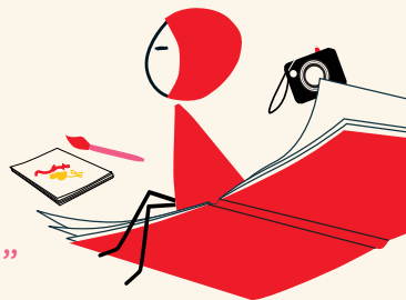
Illustration de : @ninalittlered